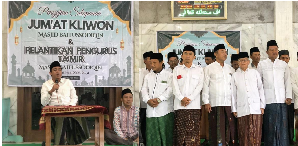
Gambar 4. Pelantikan Takmir Masjid sekaligus kader dakwah lingkungan

Refleksi akhir pada tahap ini menyimpulkan bahwa pendekatan ekoteologi yang diterapkan melalui institusi keagamaan lokal mampu memecahkan kebuntuan edukasi lingkungan di pedesaan. Masjid di Desa Pucangrejo kini tidak hanya megah secara fisik, tetapi juga memancarkan spirit spiritualitas hijau yang menjadi ruh bagi visi Pucangrejo Ecovillage . Keberlanjutan program ini dijamin melalui komitmen takmir masjid yang menyepakati bahwa isu lingkungan akan tetap menjadi agenda rutin dalam setiap forum keagamaan, memastikan bahwa spirit KKN STIK tetap hidup meski masa pengabdian telah usai.