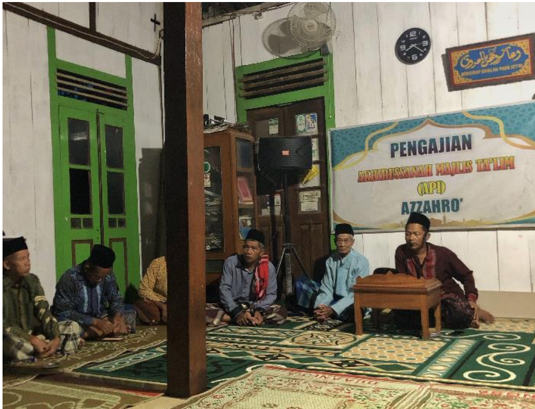
Gambar 2. Internalisasi ekoteologi melalui kajian keagamaan

transformasi kognitif jamaah. Mahasiswa memfasilitasi integrasi pesan-pesan pelestarian alam ke dalam materi khutbah Jumat dan kajian majelis taklim, di mana ayat-ayat Al-Qur'an mengenai peran manusia sebagai khalifah fil ardh (wakil Tuhan di bumi) dibedah secara kontekstual. Dengan menjadikan masjid sebagai episentrum, nilai-nilai etika lingkungan Islam lebih mudah diterima oleh masyarakat Pucangrejo yang religius, sehingga perubahan perilaku tidak lagi dirasakan sebagai instruksi luar, melainkan sebagai panggilan religius yang suci dan mendalam.