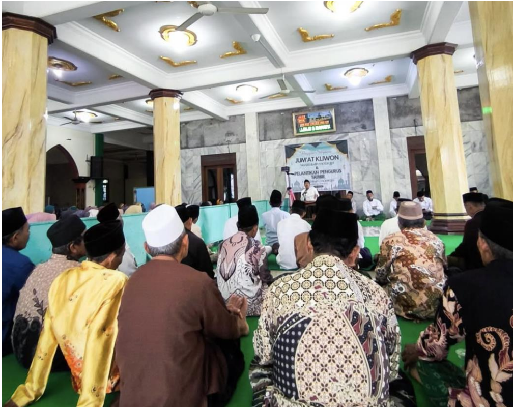
Gambar 3. Penguatan Literasi Ekoteologi berbasis Green Mosque

datang untuk beribadah secara individual, tetapi juga memiliki tanggung jawab kolektif terhadap kenyamanan dan kesehatan lingkungan tempat ibadah mereka. Keberhasilan tahap ini menjadi fondasi kuat bagi kemandirian masyarakat dalam menjaga moralitas lingkungan di level yang lebih luas.