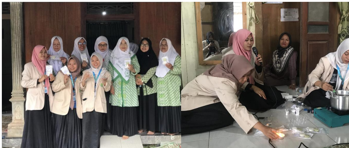
Gambar 8. Pembuatan Lilin Aromaterapi di Desa Pucangrejo

menjadi produk bernilai guna berupa lilin aromaterapi. Program ini dirancang untuk memberikan solusi ganda: mengurangi polusi lingkungan sekaligus membuka peluang ekonomi kreatif bagi ibu-ibu rumah tangga dan kader PKK. Dalam kerangka PAR, kegiatan ini diawali dengan demonstrasi teknis mengenai proses pemurnian minyak jelantah menggunakan bahan alami hingga tahap pencampuran aroma dan pencetakan lilin. Antusiasme peserta menunjukkan bahwa terdapat potensi besar dalam pengelolaan sampah skala rumah tangga jika diberikan sentuhan inovasi yang sederhana namun aplikatif.