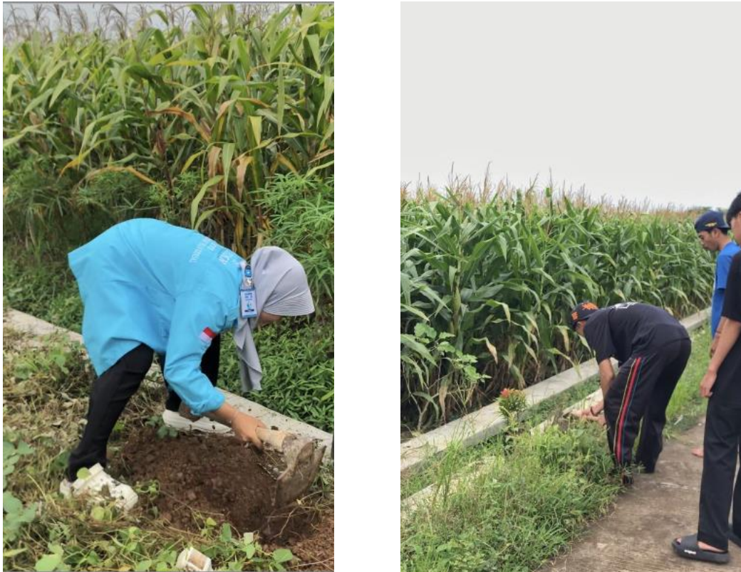
Gambar 5. Penanaman pohon pucuk merah di sepanjang jalan desa

Dalam pelaksanaannya, Kelompok XV KKN STIK berperan sebagai jembatan antara kebutuhan teknis dan mobilisasi massa. Mahasiswa mendampingi warga dalam memetakan lahan kritis dan area publik yang memerlukan vegetasi tambahan, seperti pinggiran jalur Pantura dan batas-batas persawahan. Pola penanaman dilakukan secara partisipatif, di mana warga secara sukarela menyiapkan lubang tanam dan menyediakan pupuk organik hasil olahan mandiri. Pendekatan ini bertujuan untuk menumbuhkan rasa memiliki ( sense of ownership ) yang tinggi dengan prinsip warga yang menanam adalah warga yang merawat. Pendidikan lapangan mengenai teknik pemeliharaan pohon diberikan oleh mahasiswa untuk memastikan tingkat keberlangsungan hidup tanaman yang tinggi. Aktivitas ini secara tidak langsung membentuk pola hidup sehat atau good living di mana lingkungan yang asri dan rindang memberikan kualitas udara yang lebih baik bagi penduduk desa. Sinergi antara mahasiswa dan warga dalam aksi penghijauan ini menjadi bukti nyata bahwa pemberdayaan masyarakat paling efektif terjadi saat aksi fisik dibarengi dengan pemahaman akan manfaat jangka panjang bagi kualitas hidup mereka sendiri.