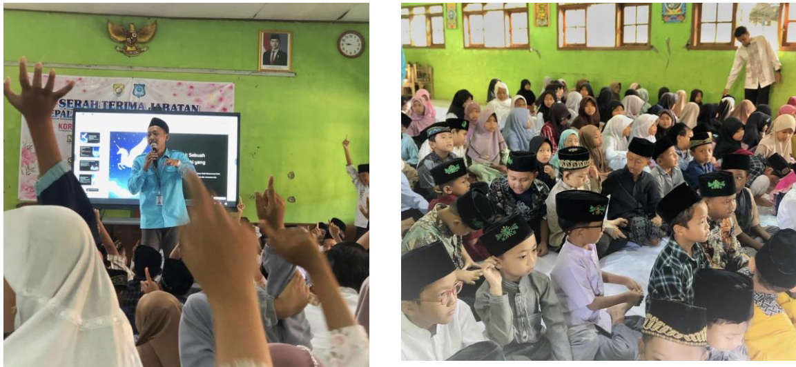
Gambar 7. Penguatan pemahaman Ekoteologi pada generasi alpha Pucangrejo

Alpha tidak lagi melihat menjaga kebersihan sebagai tugas sekolah semata, melainkan sebagai bentuk pengabdian kepada Tuhan yang menyenangkan dan bermakna.